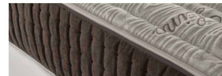
Rivestimento V.417 Lino

Materasso adatto anche alle reti con movimento . Con fascia 3D traspirante (escluso tessuto TENCEL/CACHEMIRE e LINO), 4 maniglie di presa (2 per lato lungo), con doppia cerniera su 4 lati divisibile e con maglina in jersey.