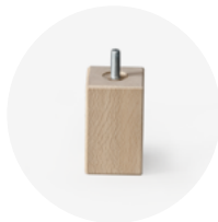
PIEDE IN LEGNO H.10 Art.232

piede in legno a forma quadra 60x60 mm colore faggio naturale avvitabile