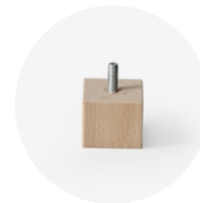
PIEDE IN LEGNO H.5 Art.231

piede in legno a forma quadra 60x60 mm colore faggio naturale avvitabile