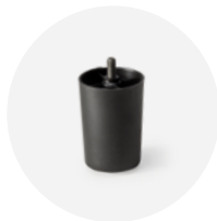
PIEDE IN PLASTICA NERO H.10 CON TAPPO Art.227

forbici per unione di 2 sommier singoli avvitate al perimetro del sommier