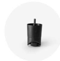
PIEDE IN PLASTICA NERO H.10 CON RUOTA Art.228

piede con ruota seminascosta Ø 70/60 mm avvitabile