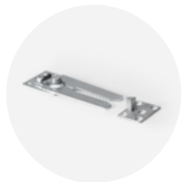
COPPIA FORBICI DI UNIONE PER SOMMIER Art.226

forbici per unione di 2 sommier singoli avvitate al perimetro del sommier