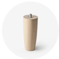
PIEDE IN LEGNO H.15 Art.233

piede in legno a forma quadra 60x60 mm colore faggio naturale avvitabile