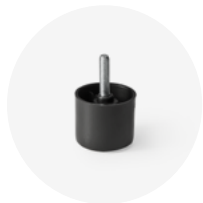
PIEDE IN PLASTICA NERO H.4 Art.229

piede con ruota seminascosta Ø 70/60 mm avvitabile